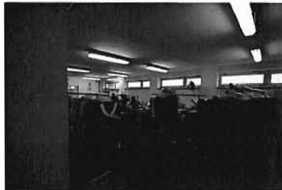
PRZYZIEMIE SEGMENTU E