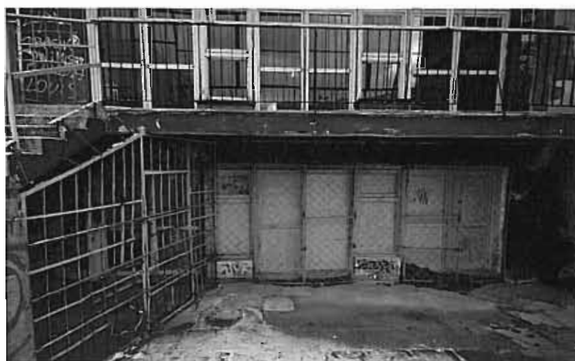
ZESTAW OKIEN I DRZWI Z PRZYZIEMIA ŁĄCZNIKA OD STRONY ZEWNĘTRZNEJ